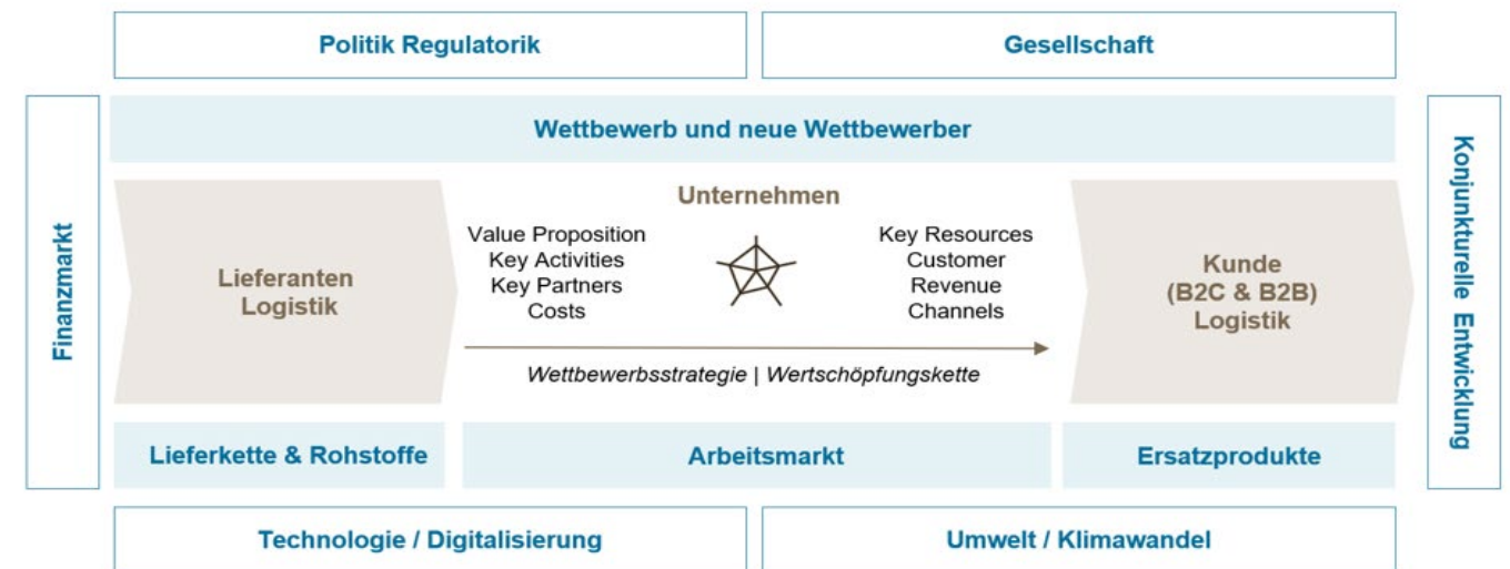
Abbildung 2: Framework Demografischer Wandel